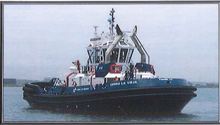
CERRO LA VIEJA