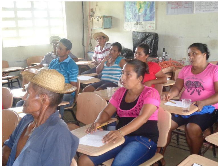
Participantes del Grupo Focal en Tramo Medio de la Cuenca de Río Indio