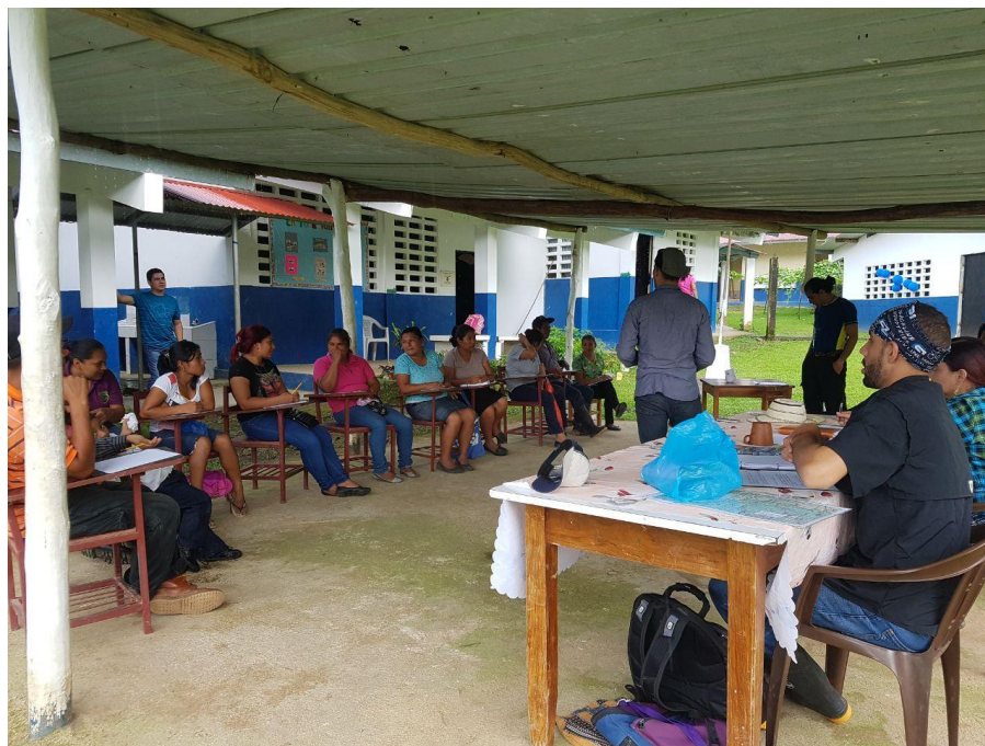
Grupo Focal realizado en Río Indio Nacimiento Tramo Alto - Río Indio